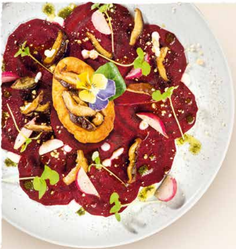
◀ 11er Mini-Schiffchen gefüllt mit gebratenen Shiitake-Pilzen dazu Rote-Bete-Carpaccio auf Soja-Meerrettich- Creme, Radieschen, Bärlauch-Pesto und veganem Parmesan aus Nüssen