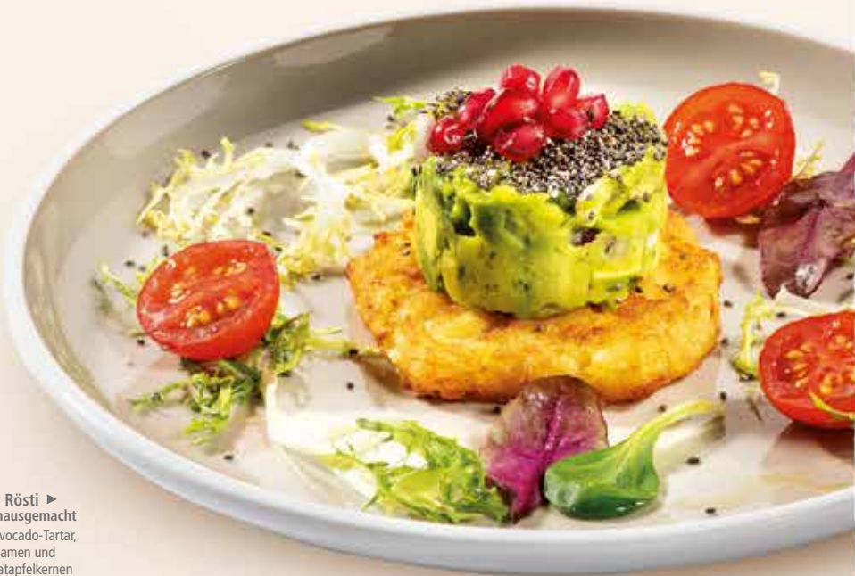
11er Rösti ▶ wie hausgemacht mit Avocado-Tartar, Chiasamen und Granatapfelkernen dazu feine Blattsalate