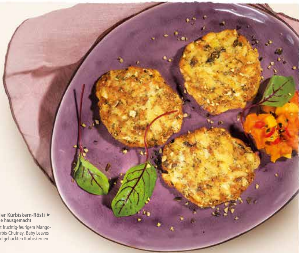
11er Kürbiskern-Rösti ▶ wie hausgemacht mit fruchtig-feurigem Mango- Kürbis-Chutney, Baby Leaves und gehackten Kürbiskernen

* ALLERGEN FREI: Laut Rezeptur ohne Verwendung der 14 deklarationspflichtigen Allergene gemäß Verordnung EU Nr. 1169/2011 (Anhang II).